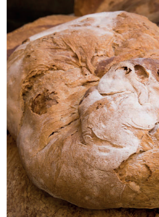
Pa Forn Pujals.