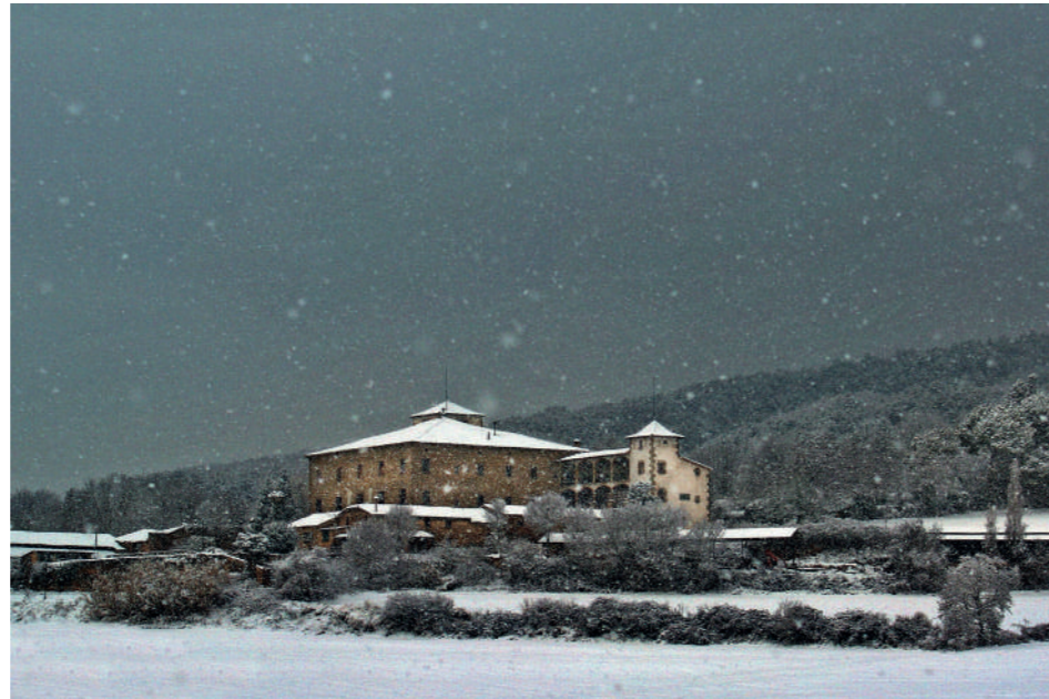
El Vilar.