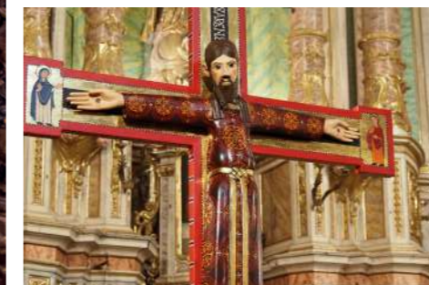
Majestat de Sant Boi.