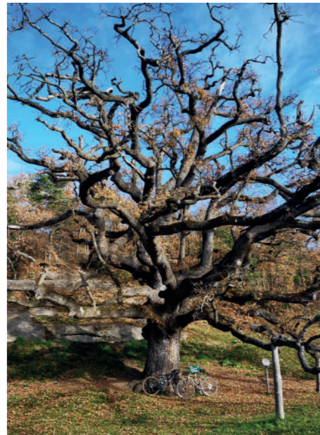
Roure de la senyora.