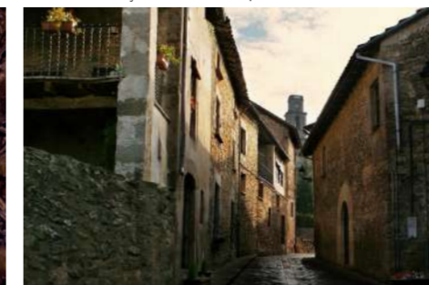
Sant Boi de Lluçanès.