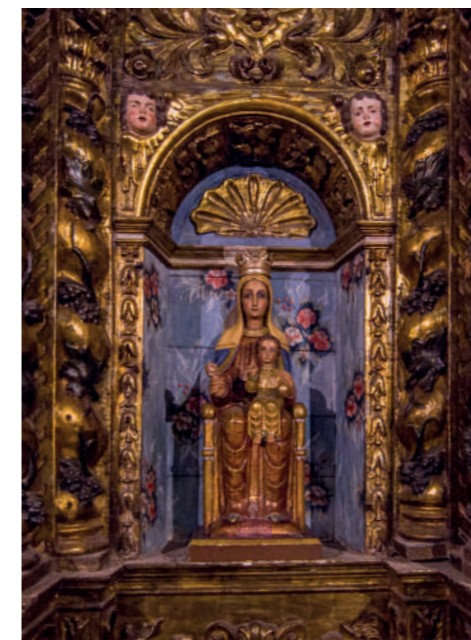
Retaule Barroc.

L'església conserva un dels tresors de l'art barroc més importants de Catalunya: vuit retaules originals barrocs i neoclàssics, datats entre els segles XVII i XVIII.