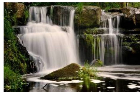
Font de les Donzelles.