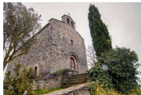
Sant Salvador de Bellver.

Sant Salvador de Bellver és una església romànica de grans dimensions que es troba ubicada a la punta d'una carena des d'on es pot gaudir de belles vistes i d'una àmplia panoràmica.